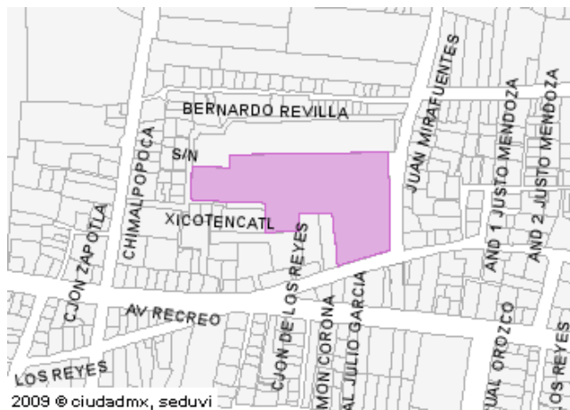
2009 Predio Seleccionado

Este croquis puede no contener las ultimas modificaciones al predio, producto de fusiones y/o subdivisiones llevadas a cabo por el propietario.